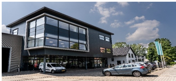
Marconibaan 44 te Nieuwegein, Hoofdvestiging

Quint & van Ginkel beschikt over een actueel en integraal managementsysteem volgens MVO-Prestatieladder 3.0, trede 3. Het managementsysteem is ingericht conform de certificatie-eisen van de normen: